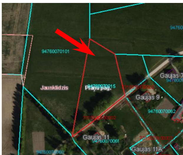
Novietojuma shēma saskaņā ar VZD Kadastra datiem

platība: 0,4176 ha; forma: tuva trapecēci; reljefs: līdzens; apaugums: ganības; labiekārtojums: zeme nav meliorēta; nožogojums: -; inženiertīkli: -; LIZ novērtējums ballēs: 50.