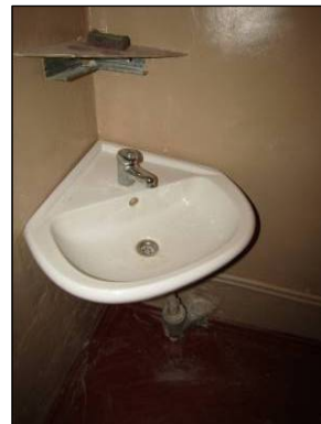
Skats uz vannas istabu un tualeti