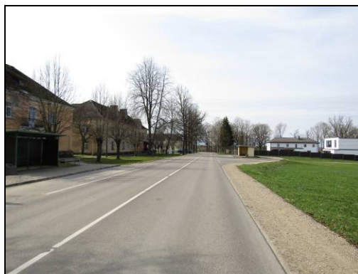
Skats uz dzīvojamo māju, Valmieras ielu