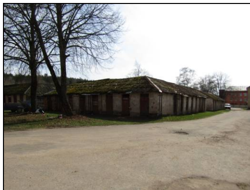
Skats uz palīgēku