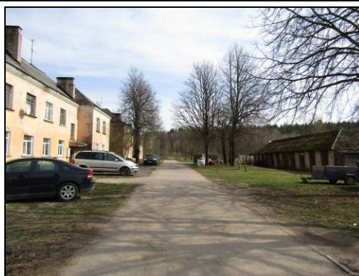
Skats uz pagalmu