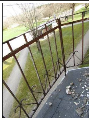
Skats uz balkonu