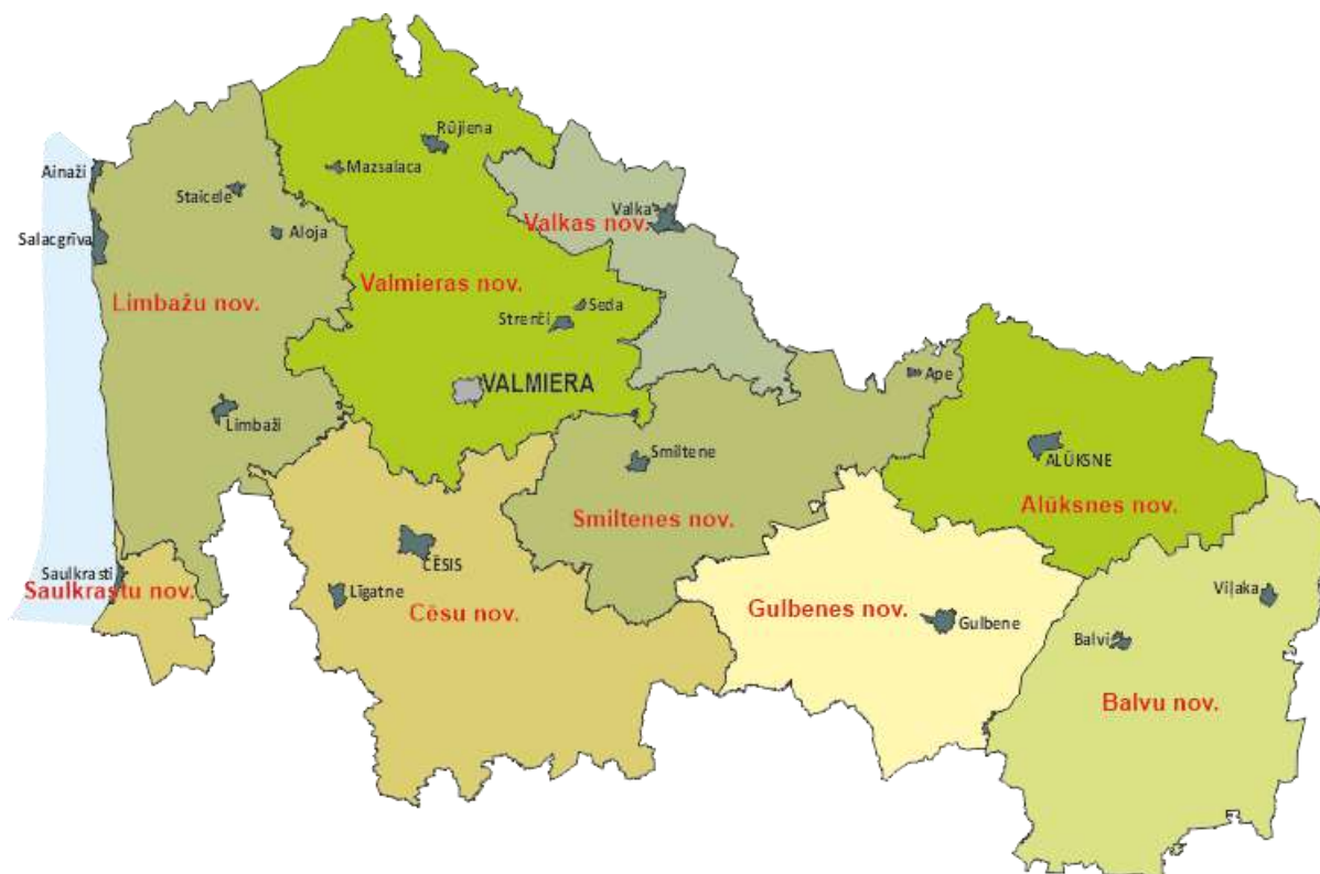
Attēls 2-1 Vidzemes AAR – administratīvi teritoriālais iedalījums