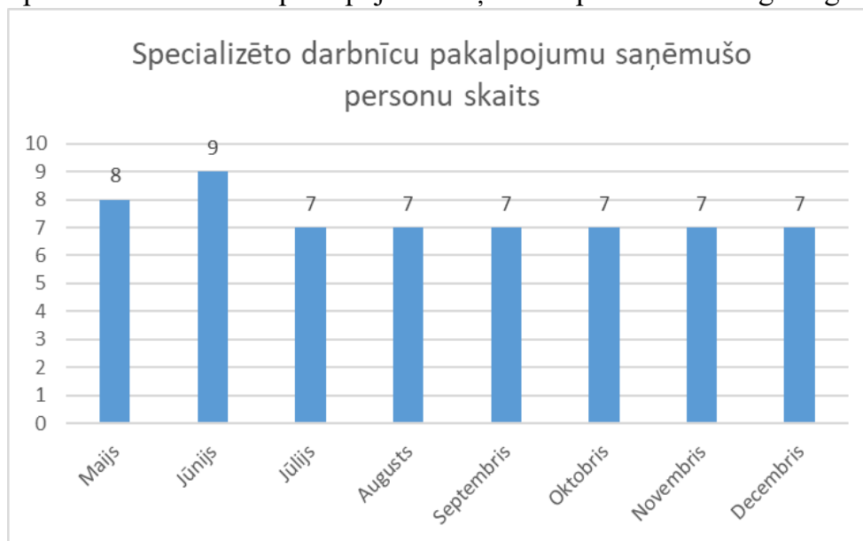
Specializēto darbnīcu pakalpojumu saņēmumu personu skaits gada griezumā.

Specializēto darbnīcu pakalpojums nodrošina darba prasmju apguvi, specializējoties darbā ar mālu. Ikdienā klientiem tiek piedāvātas papildus citas aktivitātes un nodarbības, veicinot dažādu dzīves prasmju attīstību.