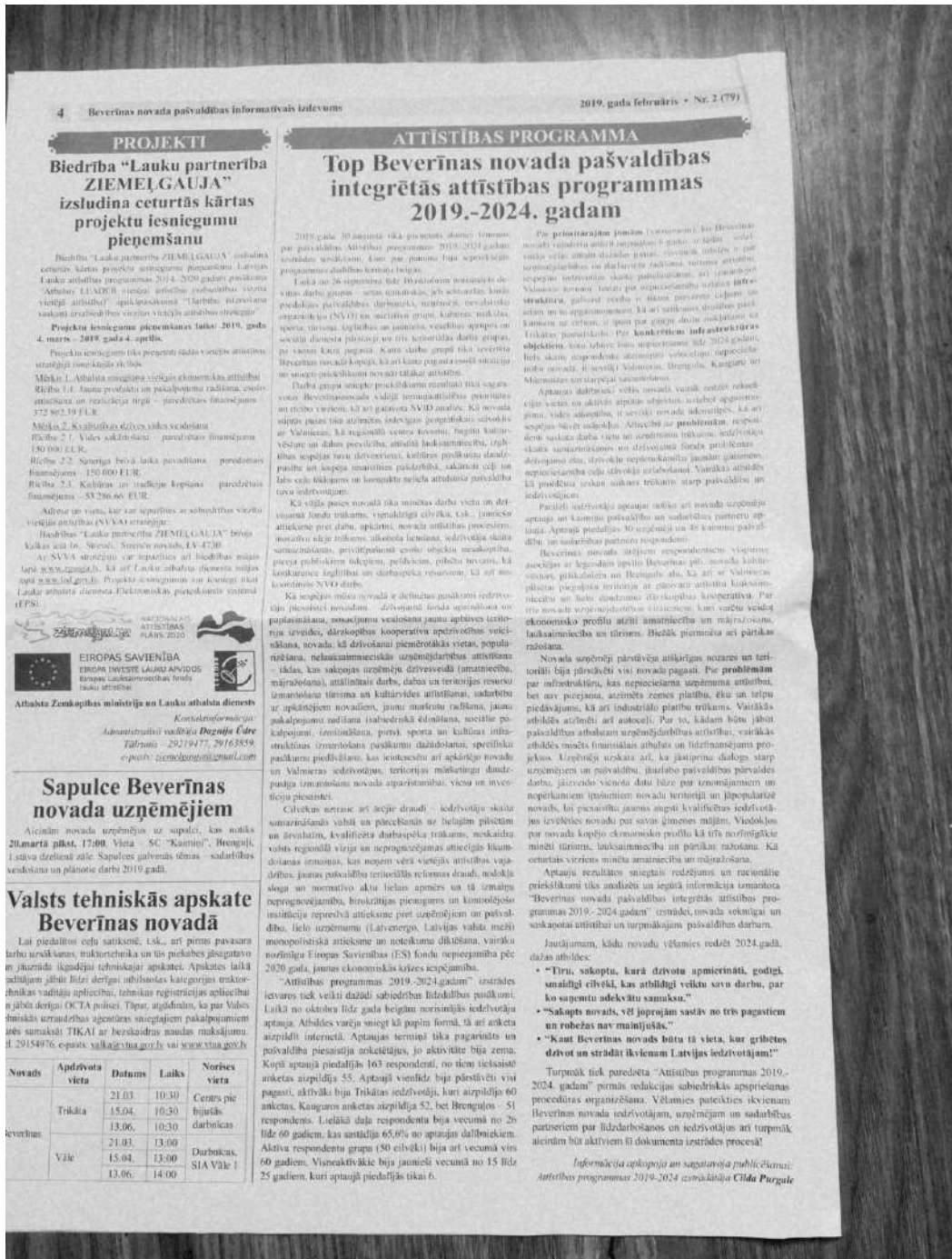
Publicēts Beverīnas novada pašvaldības informatīvajā izdevumā „Beverīnas Vēstis”2019.gada februāra numurā)