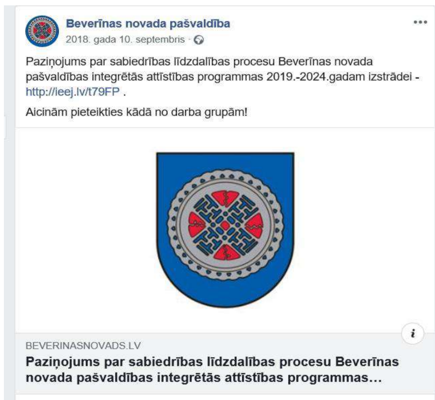
Ievietots Beverīnas novada pašvaldības sociālajā tīklā facebook.com 10.09.2018.