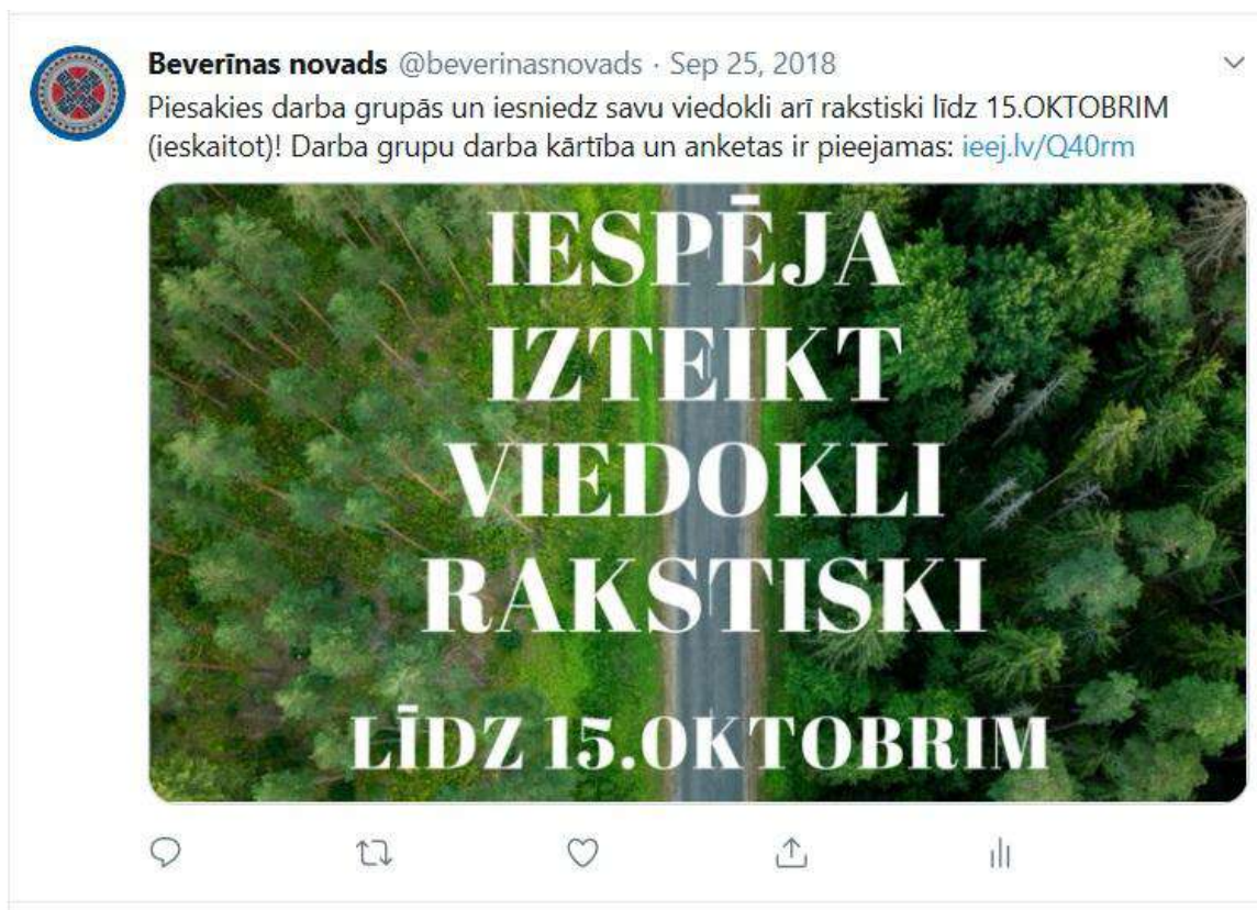
Ievietots Beverīnas novada pašvaldības twitter kontā 25.09.2018.