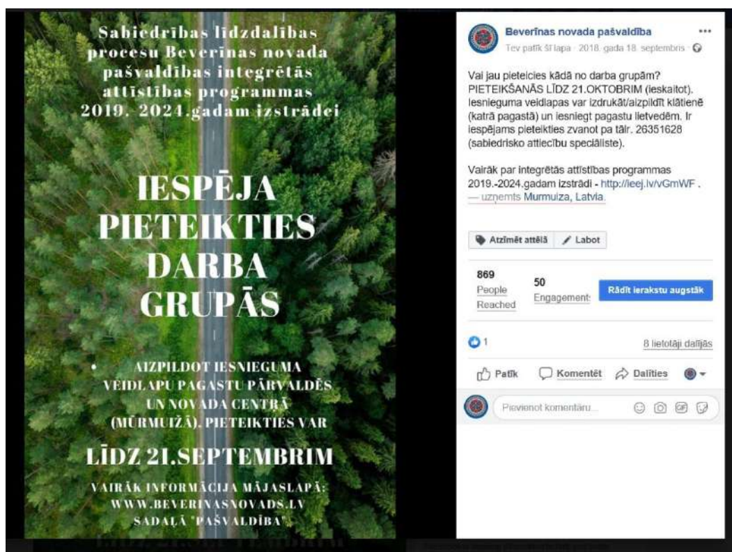
Ievietots Beverīnas novada pašvaldības sociālajā tīklā facebook.com 16.09.2018.