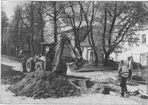
VALDEMĀRA IELAS REKONSTRUKCIJA.