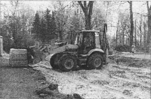
FINIŠA TAISNĒ. Tiktāl ir labiekārtojuma projekts pie Rūjienas vidusskolas.