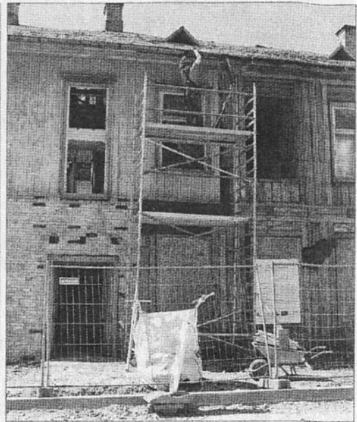
VECĀS SLIMNĪCAS ĒKA. 2021. gada maijs – atjaunotne ir sākusies!