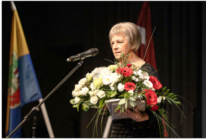
Sveicam un lepojamies!

"Ja man būtu iespēja sākt visu no jauna, būt par medmāsu joprojām būtu vienīgais variants profesijas izvēlē. Traumatoloģija ir mana sirdslīta. Atceros pirmos pacientus gan Limbažu slimnīcā, kur sāku darba gaitas, gan Valmierā. Tie bija ļoti smagi gadījumi. Esmu domājusi par to, vai būtu palikusi traumatoloģijā, ja nebūtu to piedzīvojusi jau sākumā. Tas man deva apziņu, kas ir arī kā mans moto, – es nedaru cilvēkam lielākas sāpes, es viņam palidzu, tas man ir noteikti jādara."