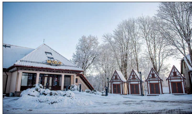
Valmieras muzejs – stāsti, kas atklāj un iedvesmo

Vingrošana grūtniecēm Vingrošana grūtniecēm ūdenī ir zemas intensitātes grupu nodarbība.