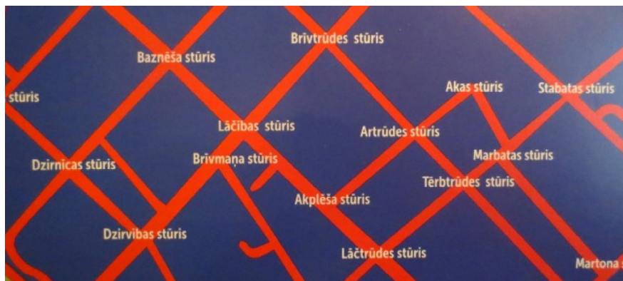
Rīgas stūru karte, Aleksandrs Zapojs & Līva Rutmane, 2014