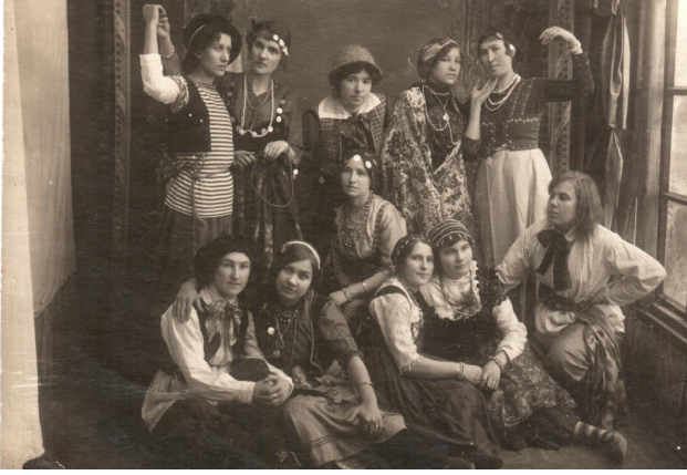
Mazsalacas pašdarbnieki pēc teātra izrādes. Ārgaļa mājā, ap 1915.g.

[...] 29. aprīlī. "Joti arvien nožēloju, ka Tevi Petrogradā nesatiku. Kamdēļ Tu man no Saratovas nerakstīji, ka brauksi uz rotu Petrogradā. Daudz jāstrādā ar fotogrāfijām, maz laika rakstīt. Drīz Tev vēl rakstīšu. Kā ar veselību? Sirsnīgi sveicieni jums abiem no zaldāta. [Jūlijs]"