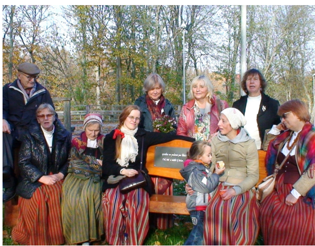
Ansambļa viesošanās Mazsalacā 2019. gada 16. oktobrī

uzvedumā piedalīsies arī Ventspils lībiešu dziesmu ansamblis „Rāndalist”.