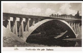
Dzelzceļa tilts saspridzināja 1944. gada 24. septembrī

Fotografēšana caur gadsimtiem būs laika dokumentēšana un vērtības radīšana nākotnei.