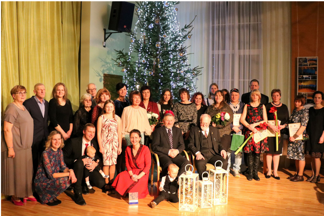
Svinīgā apbalvojumu saņemšana Mazsalacas novada Kultūras centrā 2019. gada 28. decembrī