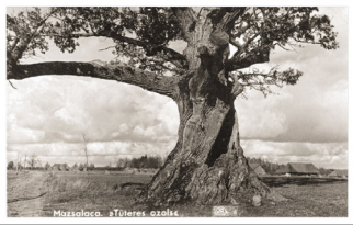
Tūteres ozolu lauza 1967. gada rudens vētra

Fotografēšana caur gadsimtiem būs laika dokumentēšana un vērtības radīšana nākotnei.