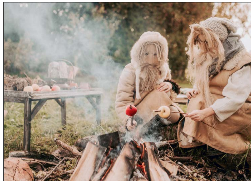
Valmiermuižā ar tradīcijām un tirgošanos tiks sagaidīta Mārtiņdiena

Sanākušie varēs mīloties ar Valmiermuižas alus virtuves un darītavas meistaru sarūpētajiem ēdieniem un dzērieniem.