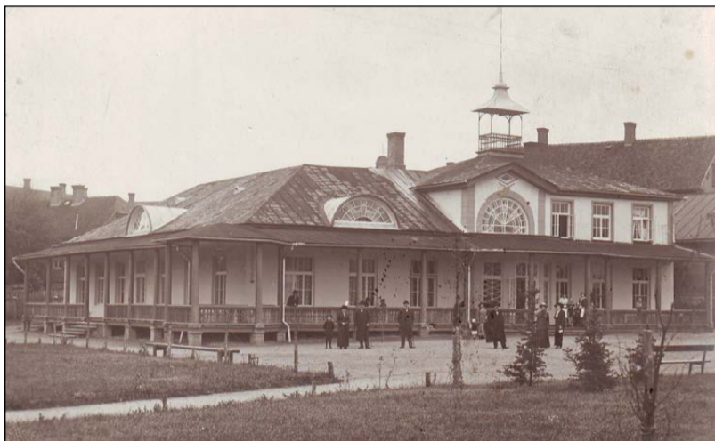
Vecpuīšu parka paviljona ēka, kurā 1918. gada 18. novembrī notika Latvijas Republikas proklamēšanai par godu noturēta sapulce