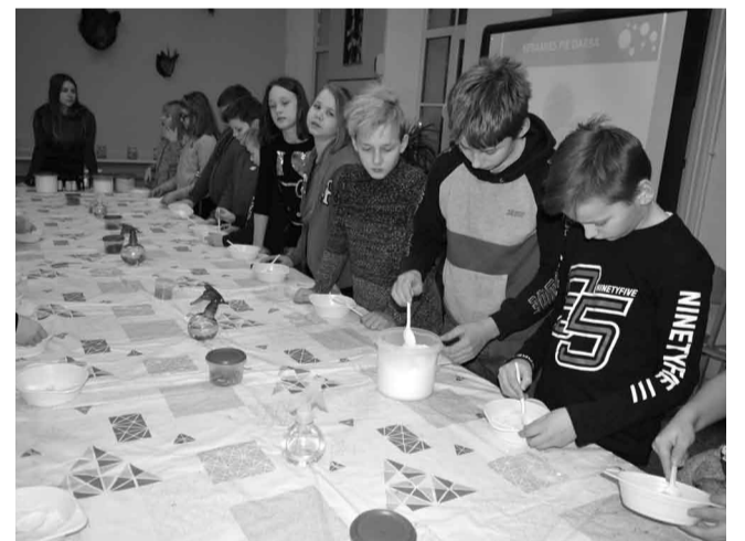
Informāciju sagatavoja: J.Endzelīna Kauguru pamatskolas direktora vietniece izglītības jomā Dzintra Sijāte

Darbnīcas vadīja Aspired Interactives, Ventspils Augsto Tehnoloģiju Parks 5, speciālisti.