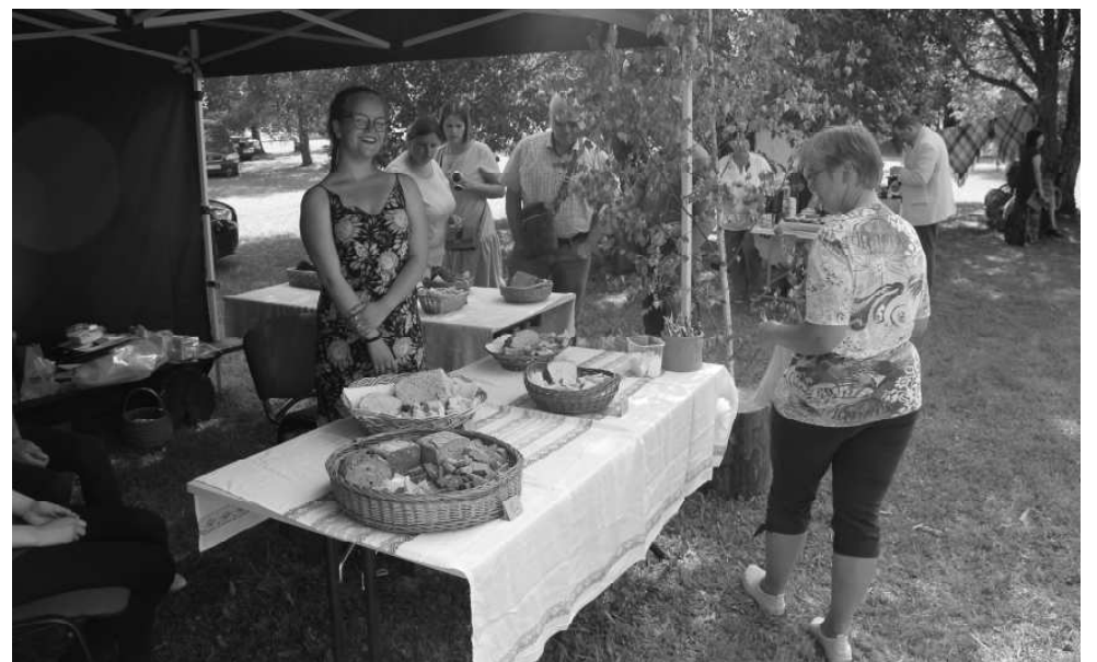
Maizes konkursā apmeklētājiem bija iespēja degustēt katra veikumu un pēc tam izlasot recepti, nobalsot par sev tīkamāko.