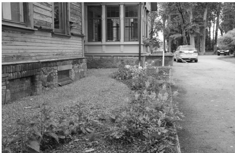
Atjaunotā puķu dobe pie Dīķeru muižas ēkas