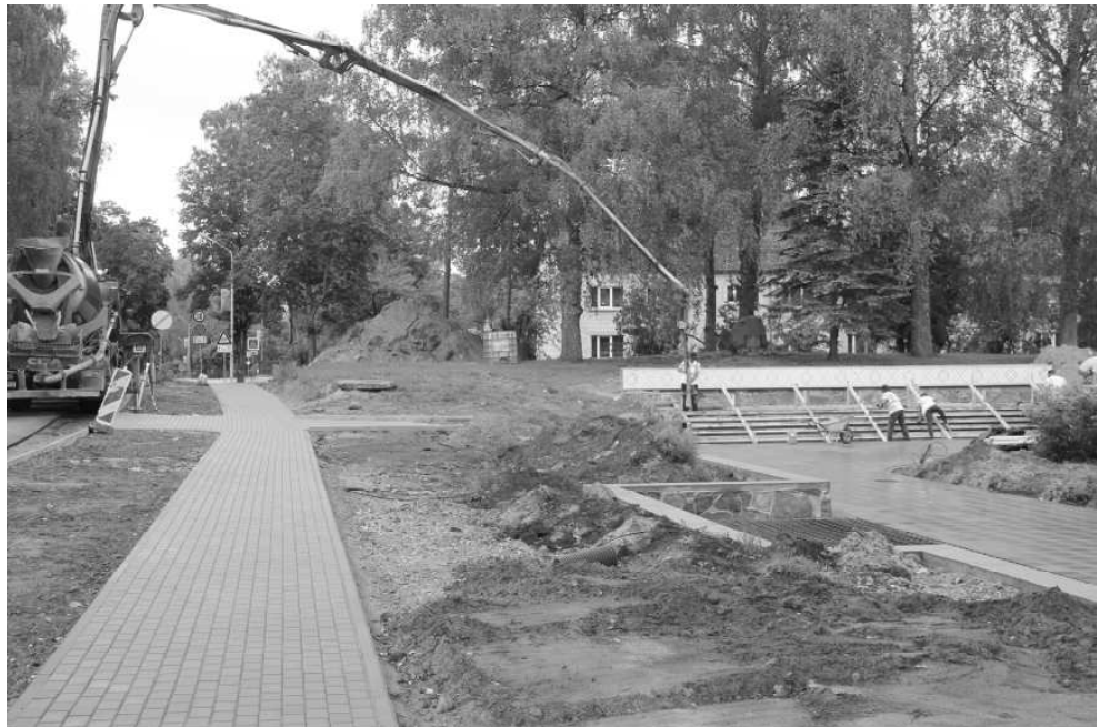
Priekšlaukuma uzlabošanas darbi pie Naukšēnu kultūras nama