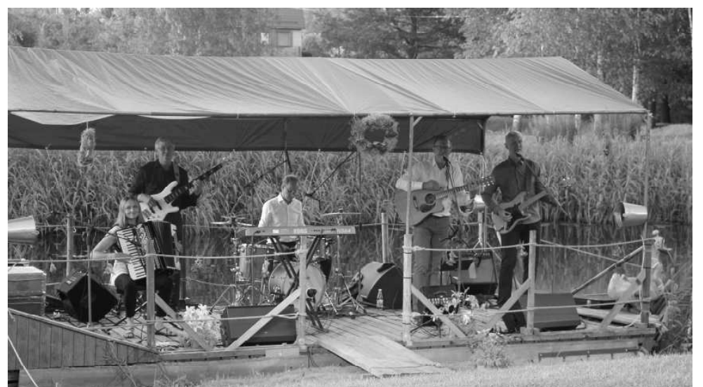
Sestdienas vakars noslēdzās ar muzikālu koncertu grupas "Lauku muzikanti" skanējumā.