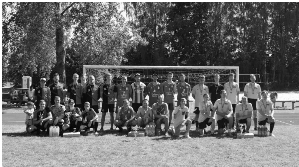
Četrpadsmit komandu konkurencē Naukšēnu novada svētku futbola turnīrā pirmās trīs vietas ieguva – “Eglītes mežs” un “Margrietiņas” no Mazzalacas, kā arī komanda “SK Brālis” no Valmieras.