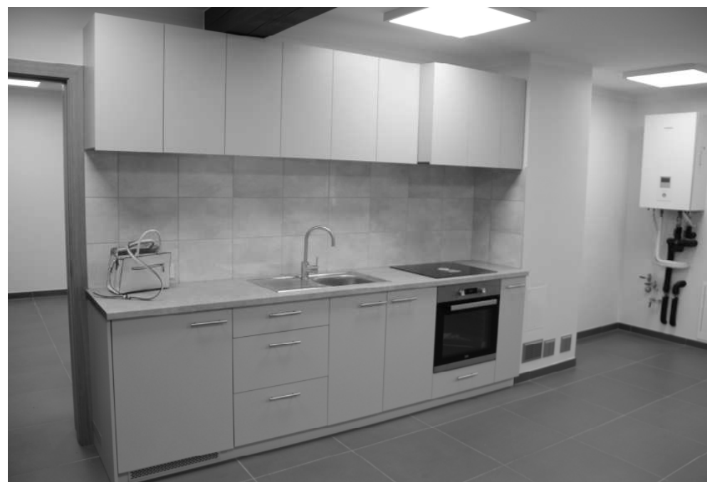
"Mazaldaru" iekštelpas pēc pārmaiņām

Papildus sociālo pakalpojumu sniegšanas vietai "Mazaldaru" ir daļa no vēsturiskā Naukšēnu muižas centra, pavisam tuvu atrodas SIA "Naukšēni" minerālūdens cehs, SIA "Bauņu sēta" vīna ražotne, Rūjas upe, SIA "Nāras" kafejnīca un viesnīca, kā arī labā stāvoklī uzturētā Naukšēnu muiža, kurā darbojas sociālās korekcijas iestāde.