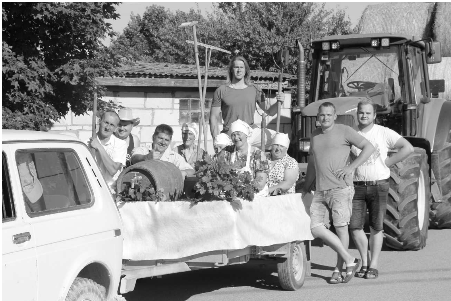
Par Naukšēnu novada svētku viskrāšņāko aktivitāti viennozīmīgi kļuva svētku brauciens “Mirkļis laika rāmītī”. Kopumā tas pulcēja 73 transporta vienības ar 178 svētku parādes dalībniekiem. Attēls: Zemnieku saimniecības “Tiltgaļi” kolektīvs gatavojas doties svētku braucienā.

Vēlāk turpat, muižas estrādē, skatītāji dzīvoja līdz izrādes “Precies, māsiņ!” varoņiem. Savukārt Cilvēkmuzejā dienā tika atklāta izstāde “Katram savu tautas tērpu”, kas veidota no naukšēniešu nesitiem tautas tērpiem un to detaļām – gan paaudzēs glabātiem, gan no jauna darinātiem. Ja nepaspējāt - izstāde vēl apskatāma līdz 15. augustam. Cilvēkmuzejā bērni pavadīja arī Multeņu nakti, aizrautīgi vērojot padomju laika sirsniņās filmiņas.